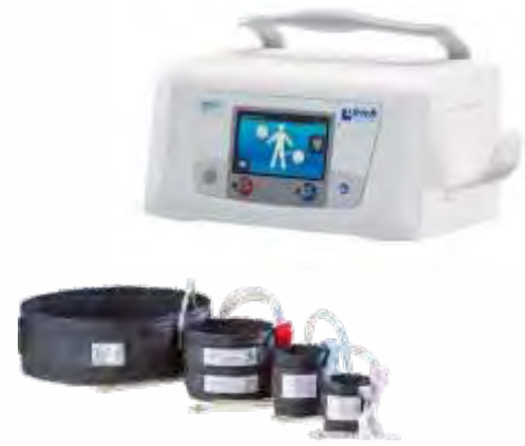
Garrotes Electrónicos e Manuais