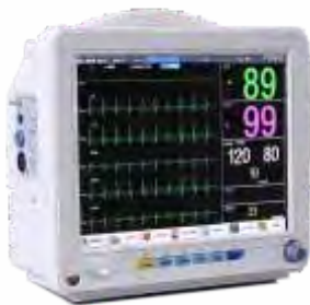
Monitores Multiparametros e de Sinais Vitais