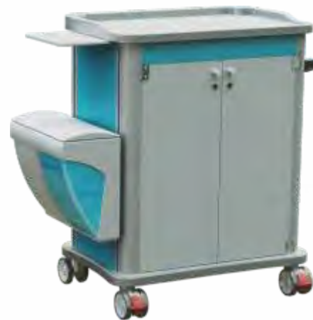
MOBITCAR Básico com gavetas e Portas