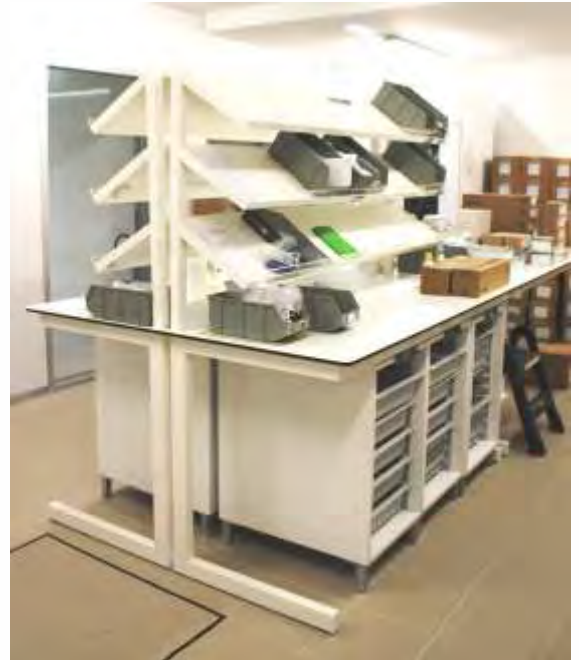
Bancada de trabalho com alçado de três prateleiras com armários modulares para utilização com tabuleiros, cestos com ou sem divisórias e prateleiras.