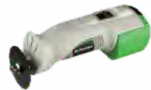
Serra de Gessos com e sem aspirador