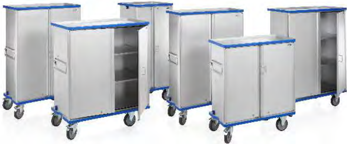
Carros de transporte em Alumínio, com diversas tipologias de interior e de diferentes dimensões.