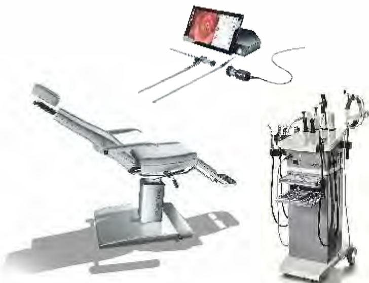
ENT/URL Cadeira de Paciente Equipa