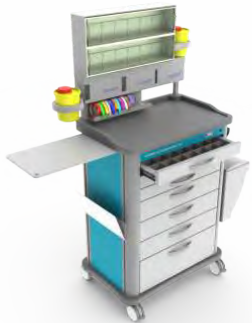
MOBITCAR Anestesia com 5 ou 7 gavetas