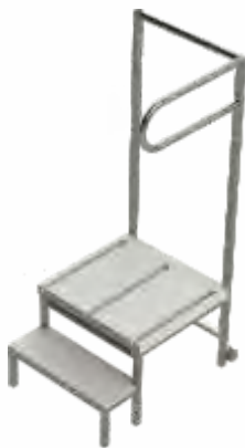
DEGRAU PARA RAIOS -X Para raio-x aos pés com carga. Estrutura metálica e parafusos sem interferirem na imagem.