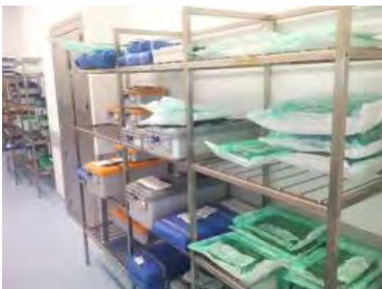
Estantes para Instrumentais em inox com diversas opções de alturas, larguras e profundidades.