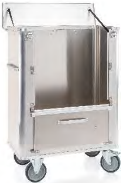
Carros de transporte em Alumínio, com diversas tipologias e de diferentes dimensões.