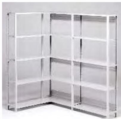
Estantes lineares com diversas opções de alturas, larguras e profundidades.