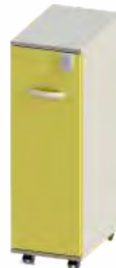
CACIFO AMBULATÓRIO Cacifo rodado em HPL com fechadura digital de código.