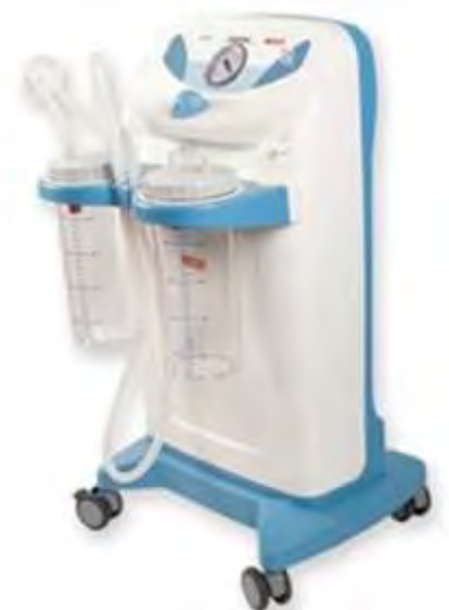
Aspiradores de Secreções