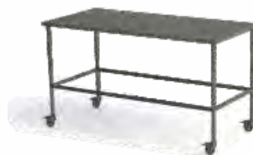
MESA INSTRUMENTOS Totalmente em inox, com rodas. Tampo reforçado. Medidas diversas.