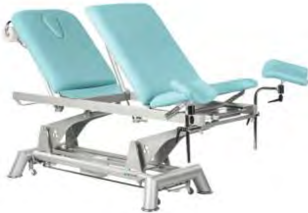
Marquesas Multifunções ou Simples com altura variável ou fixa