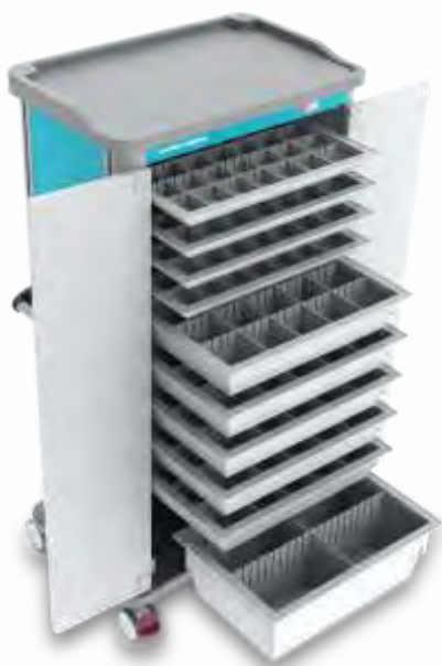
MOBITCAR Médio Alto