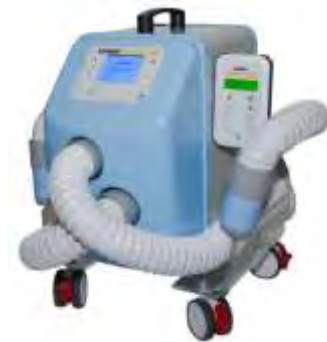
Sistemas de Aquecimento para Pacientes