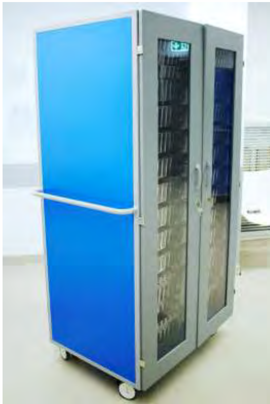
Carro de Medicação e ou Dispositivos Médicos Duplo com portas em ABS e óculo de vidro para utilização com tabuleiros, cestos com ou sem divisórias, prateleiras e outros acessórios.