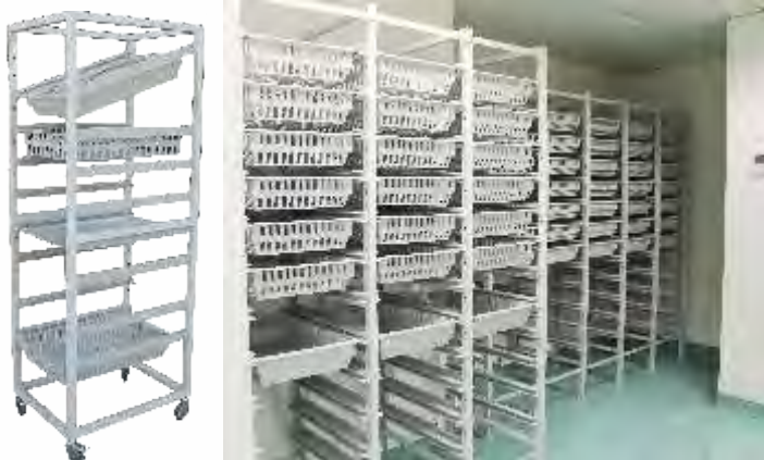
Estantes Modulares para utilização com tabuleiros, cestos com ou sem divisórias e prateleiras, com e sem rodas.