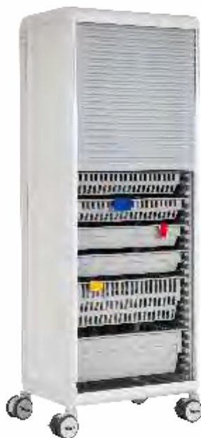
Carro de Medicação e ou Dispositivos Médicos Simples ou Duplo com persiana em ABS para utilização com tabuleiros, cestos com ou sem divisórias, prateleiras e outros acessórios.