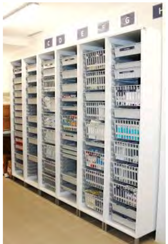
Armários Altos Modulares com e sem portas para utilização com tabuleiros, cestos com ou sem divisórias e prateleiras.