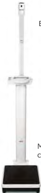
Modelo Adulto com e sem craveira