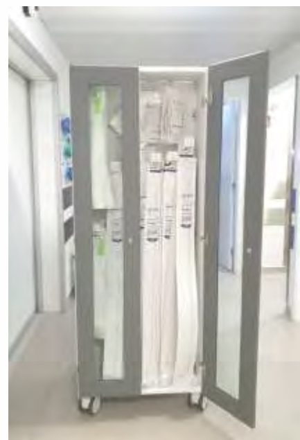
Carro de Cateteres Simples com acesso bilateral e com quatro portas em ABS e óculo de vidro. Grelha com diferentes níveis para colocação de ganchos em diferentes alturas.