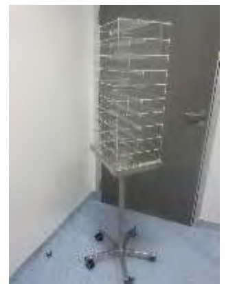
Carro rodado em inox e acrílico para Suturas.