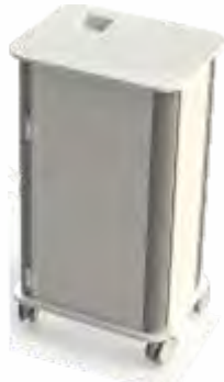
CARRO DE APOIO PARA ALA DE INFECTADOS Totalmente produzido com materiais resistentes a todos os desinfetantes.