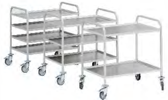
Carros de apoio em inox com opção de prateleiras em alumínio, com diversas tipologias e de diferentes dimensões.