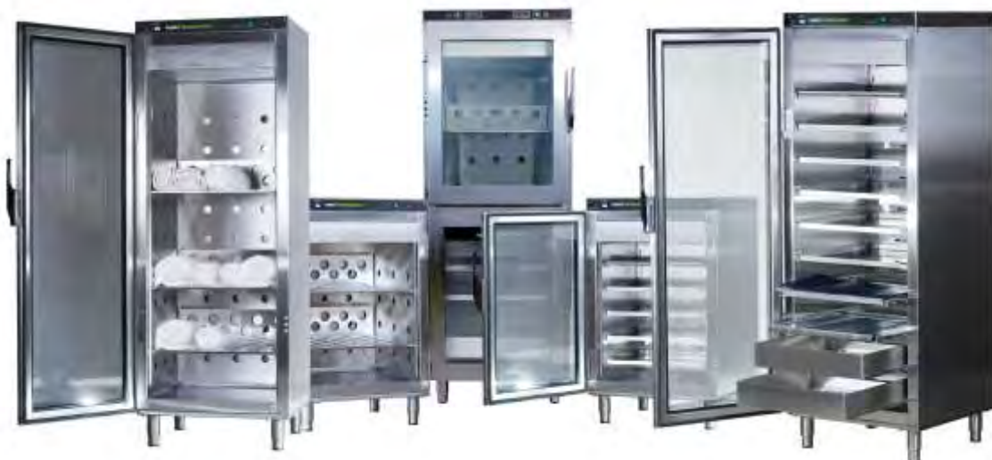
Estufas de Aquecimento para fluídos e ou tecidos