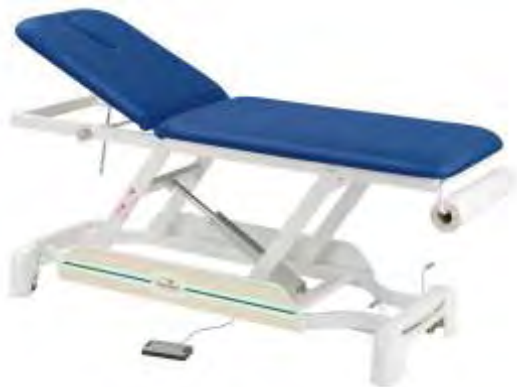
Marquesa Observações Eléctrica