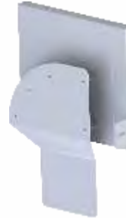
SUPORTE ENDOSCÓPIO Para Armário com fixação em calha deslizante.