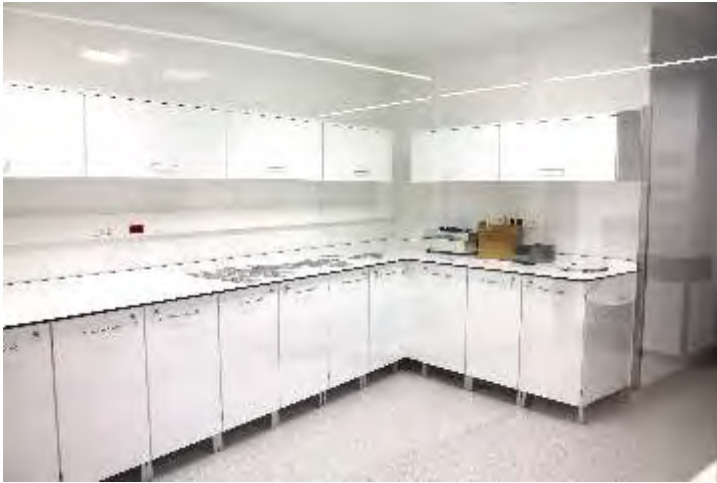
Armários Modulares para utilização com tabuleiros, cestos com ou sem divisórias e prateleiras.