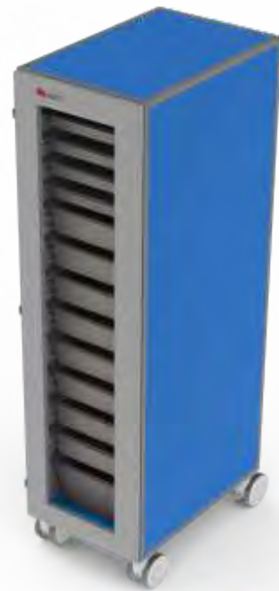
Carro de Medicação e ou Dispositivos Médicos Simples com porta em ABS e óculo de vidro para utilização com tabuleiros, cestos com ou sem divisórias, prateleiras e outros acessórios.